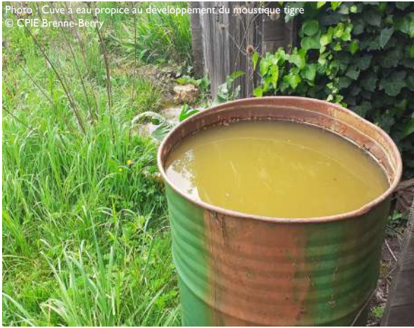
Photo : Cuve à eau propice au développement du moustique tigre

Au cours de l'été 2023, l'Agence Régionale de Santé et le CPIE Brenne-Berry ont signé une convention autour d'un programme d'actions pour les départements de l'Indre et du Cher. Croisant les enjeux de l'Agence Régionale de Santé et certains sujets d'intervention du CPIE, cette convention décline sur 3 ans des actions autour de la question de l'Urbanisme Favorable à la Santé (UFS) et des espèces à risques sanitaires, plus particulièrement, le moustique tigre.