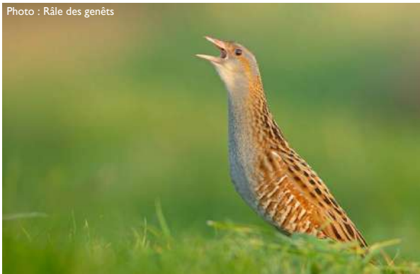
Photo : Râle des genêts

Le CPIE Touraine-Val de Loire finalise le n°2 d' Armeria , son bulletin naturaliste annuel . Celui-ci devrait être disponible en version numérique sur notre site internet et en version papier à partir du mois de mai.